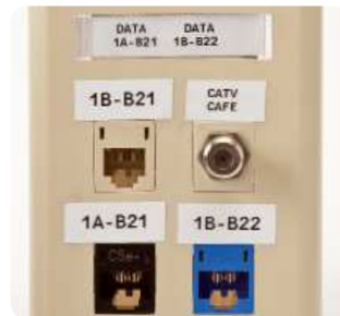
Etiketten für Blenden und Ausgänge