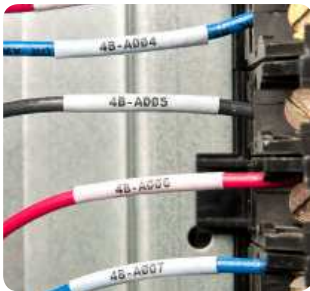
Kennzeichnung von Kabeln und Leitungen