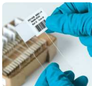
Etiketten für Objektträger