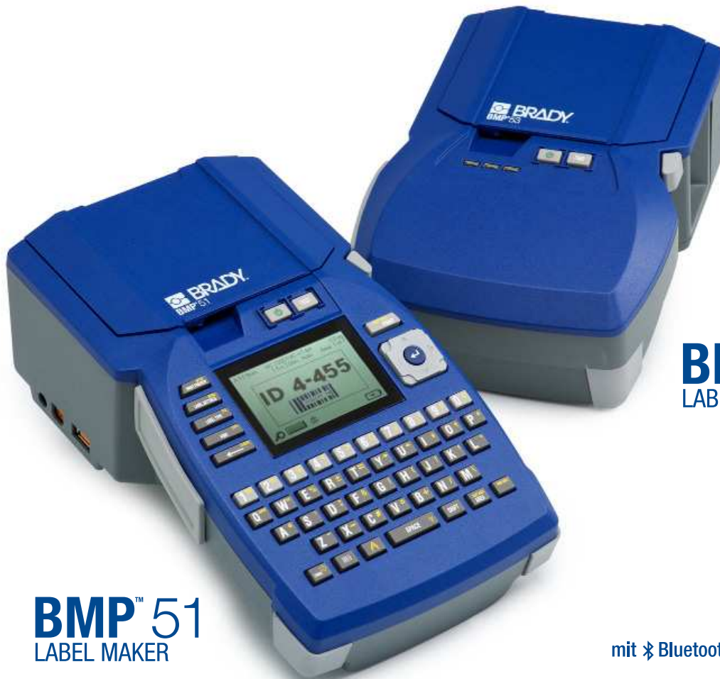
BMP™ 51 LABEL MAKER