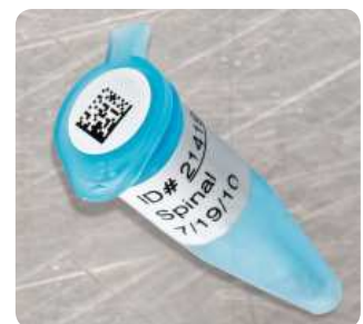
Etiketten für Zentrifugen- & PCR-Röhrchen