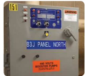
Etiketten für Bedienfelder und elektronische Schalttafeln