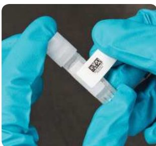
Etiketten für Cryo-Röhrchen