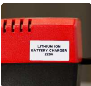
Etiketten für raue Oberflächen