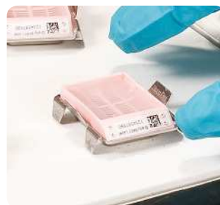
Etiketten für Gewebekassetten