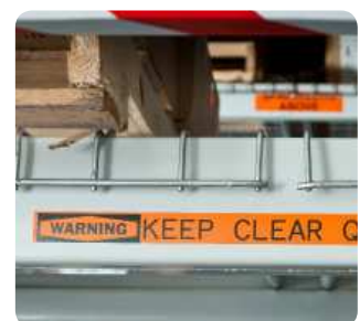
Anlagen- und Sicherheitskennzeichnungen im Innen- und Außenbereich