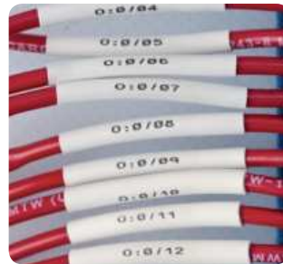
Schrumpfschläuche für Kabel PermaSleeve®