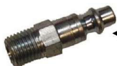
← Verengter Teil